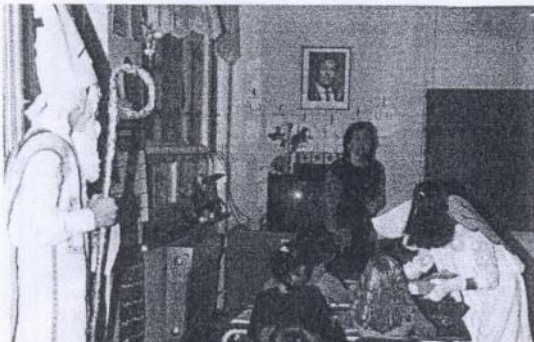
Snímek se ještě vracíme k mikulášské nadílce na naší škole.

SDH ve Ptení pořádá 26. prosince 2001 ve 14,30 hodin v místnostech sokolovny Výroční valnou hromadu.