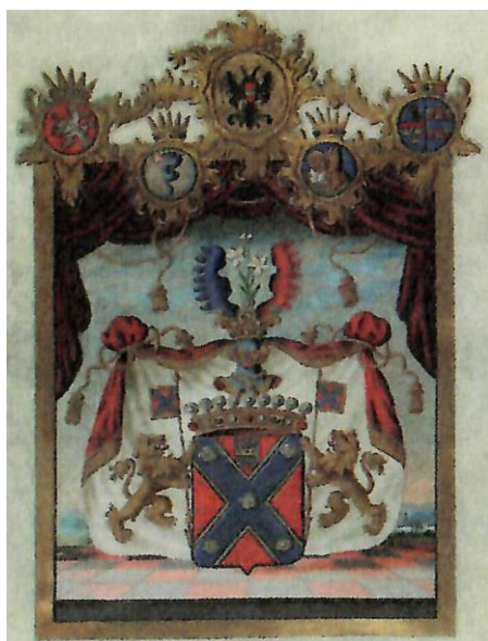
Obrázek 1: Erb rodu Saint Genois