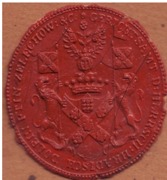
Obrázek 2: Pečeť soudního úřadu rodu Saint Genois pro panství klášterní Hradisko, Ptení a Čelechovice na Hané